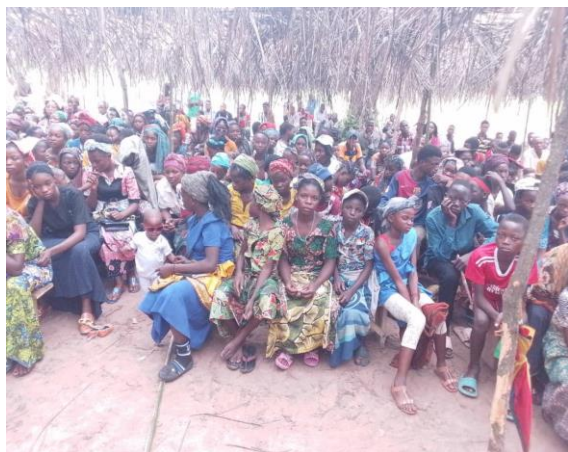
Les jeunes de la FJC