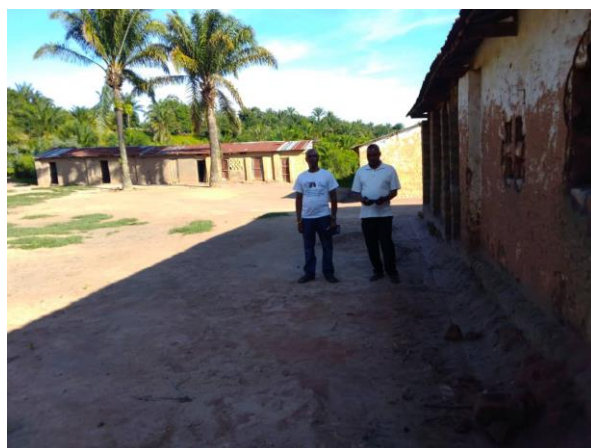
Complexe Scolaire Christ Roi