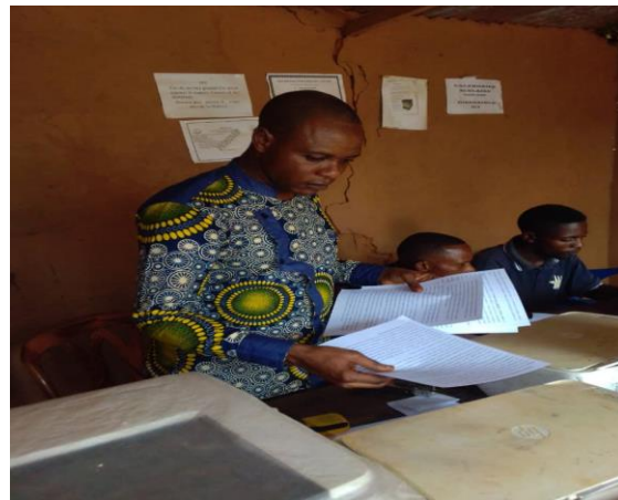
Impression de quelques chapitres traduits en Kisongye