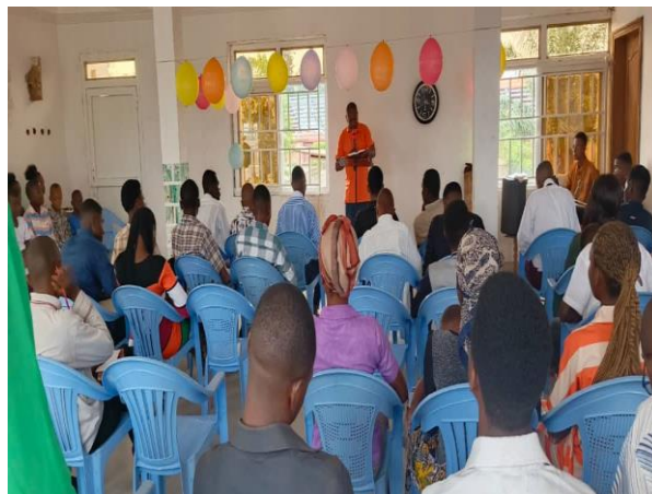
Etude de la parole de Dieu à l'assemblée Etoile