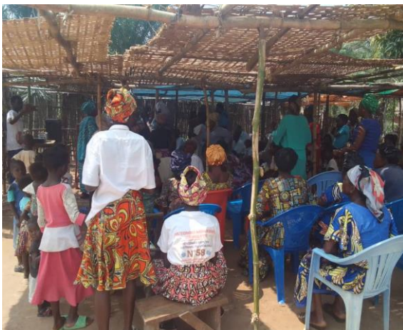
Etude de la parole de Dieu

Participation : 312 personnes (dont 209 femmes et 24 baptêmes célébrés)