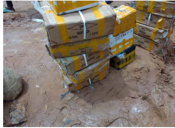
Déchargement et Réception des brochures à Kabinda