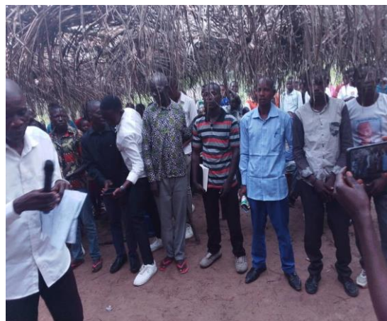
Les anciens après la réunion