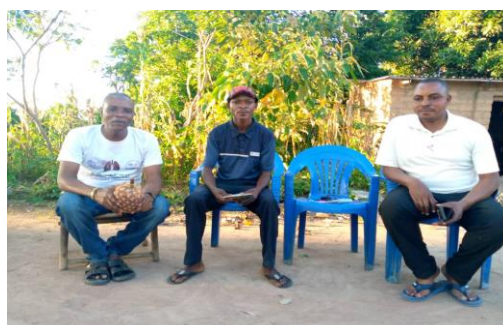
Visite de réconfort aux familles avec les anciens à Muene Ditu