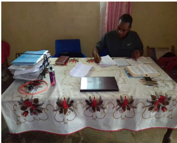
Fin de la traduction du livre marcher à la lumière du nouveau testament en Kisongye

Projets 2026 : Lancement au 1er trimestre de la traduction du livre « Le Lieu du Rassemblement pour les croyants ».