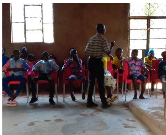
Les enfants de l'école du dimanche à Kabinda