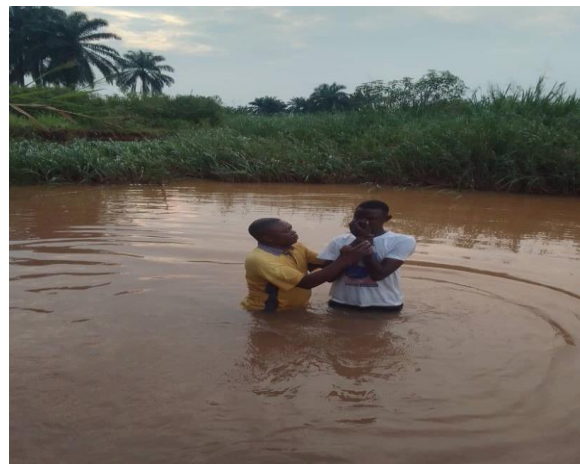
Les personnes baptisées