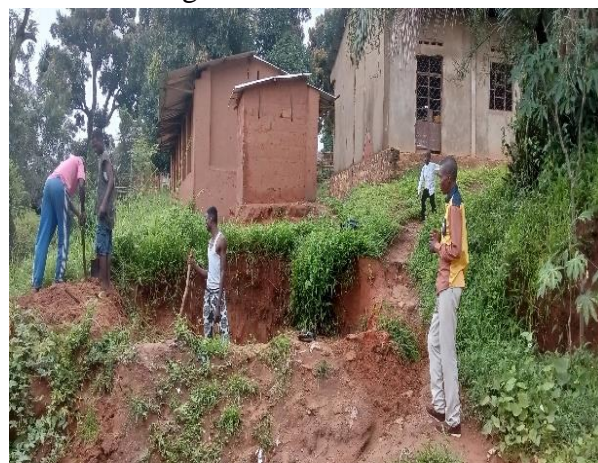
Travaux d'entretien de la parcelle station de Kabinda