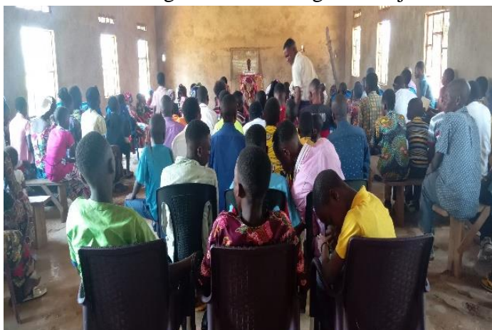
Réunions des jeunes à Kabinda