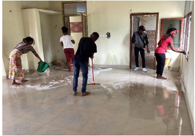
Travaux d'entretien du bureau relais de la 33 ème CERS Kinshasa par les jeunes de la Fraternité des Jeunes en Christ