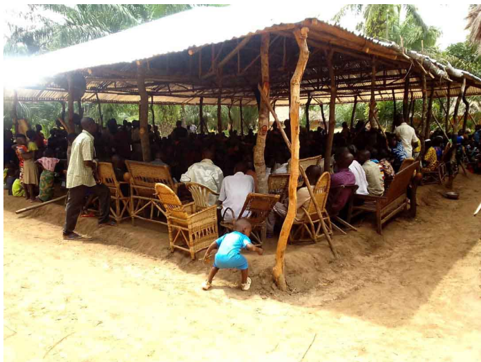
Rencontre des assemblées de la station de Munanga

Des enseignements ont été organisés dans la région de Munanga dans le but d'annoncer la bonne nouvelle pour le salut des âmes, et aussi pour affermir les frères et sœurs dans leur foi en Jésus-Christ. Ces séances d'enseignements ont été d'une grande bénédiction et ont connu la participation de 238 personnes, dont 8 personnes ont été conduites aux de baptême. (Frère Daniel KASHESHA)