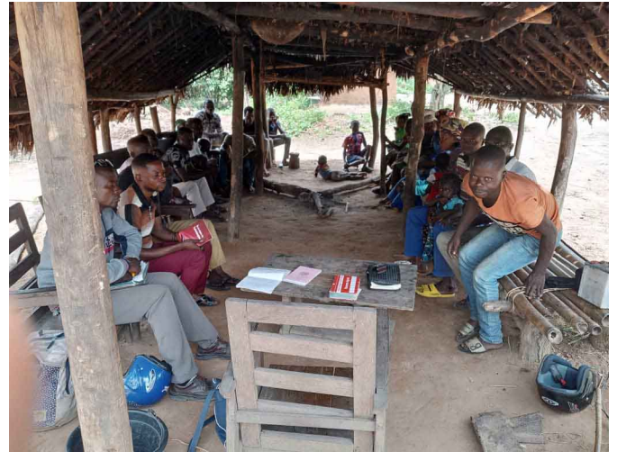
Rencontre mensuelle à l'assemblée de Diwowo