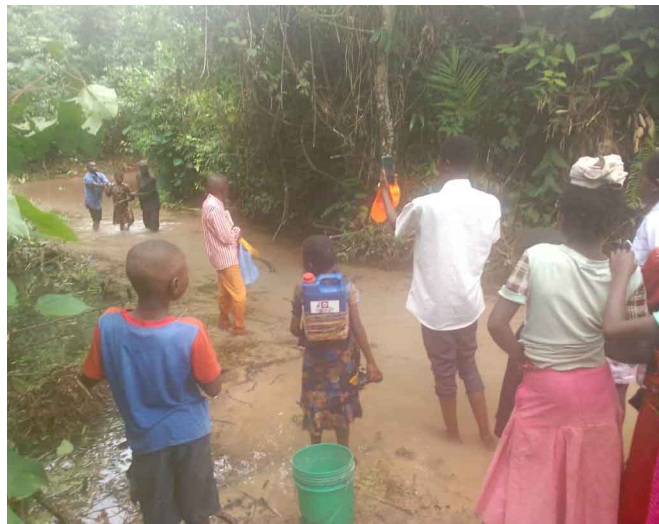
Baptême 8 personnes à Munanga