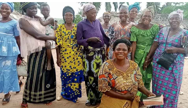
Rencontre des sœurs sur la « marche chrétienne »