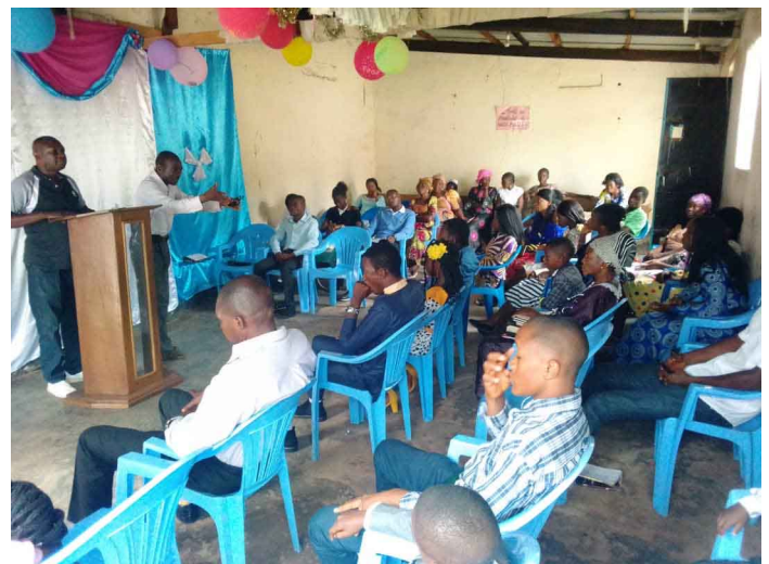
Premier Janvier 2023 à l'assemblée Etoile