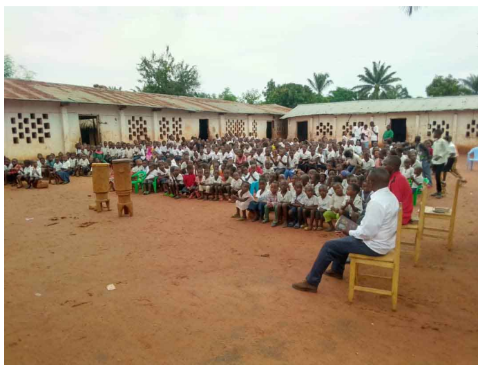
Ouverture de l'année 2023 avec les eleves de l'école primaire Muela Mokolo à Ngandajika