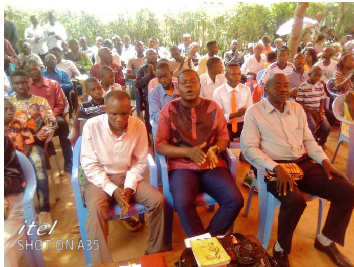
Rassemblement des frères et sœurs réuni à l'assemblée locale de Kanshi Miba, station de Mbujimayi 29 01 2023