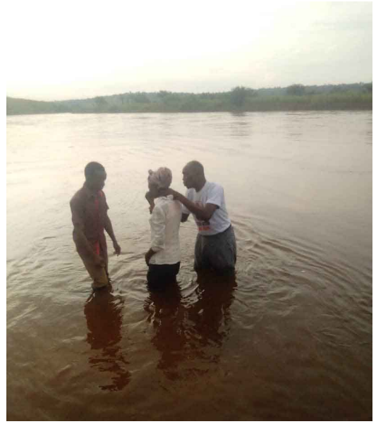
Lors de baptême à l'assemblée nouvelle ville à Mbujimayi