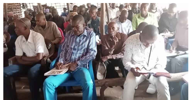
Baptême à l'assemblée de Dibumba 6 personnes ont donné publiquement leur vie au Seigneur