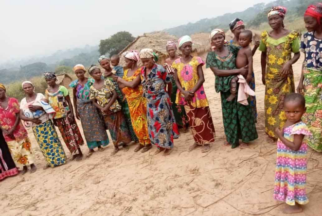
Rencontre des sœurs du 30 Décembre au 1 er Janvier 2023