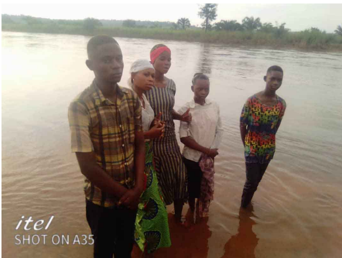
5 Personnes baptisées à l'assemblée de nouvelle ville

L'année 2023 s'est ouverte le 1 er janvier par enseignement sur le baptême à l'Assemblée Etoile et 5 nouveaux convertis ont été baptisés. Plus tard, la méditation tirée de Jérémie 1 :10 « Je t'établis aujourd'hui sur les nations et sur les royaumes, pour que tu arraches et que tu abattes, pour que tu ruines et que tu détruises, pour que tu bâtisses et que tu plantes », dans l'assemblée de Nouvelle-Ville. Cette mission, qui était un grand défi, confiée à Jérémie est aussi celle qui concerne chacun des chrétiens dans l'œuvre de DIEU pour cette année qui commence. Après ce partage de la parole de Dieu, 5 personnes (trois filles et deux garçons) ont manifesté publiquement leur volonté de suivre Jésus comme leur Sauveur et Seigneur. « Je vous dis que, de la même façon, il y aura plus de joie dans le ciel pour un seul pécheur qui se repent que pour 99 justes qui n'ont pas besoin de se repentir » Luc 15 :7. Quelle belle révélation pour nous de voir que les anges éprouvent un profond intérêt pour les pécheurs qui se rétablissent spirituellement ! C'est d'autant plus remarquable de voir que les pécheurs repentis ont une place privilégiée dans le royaume de Dieu, celle de juger et le monde et les anges (1 Corinthiens 6 : 2-3). A l'assemblée de la Kanshi, une réunion biblique a porté sur « Grandissons dans la foi ». (Frère Didier MUTOMBO)