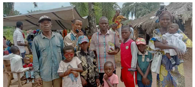
Conférence biblique sur l'axe luebo