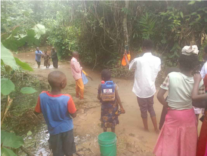
Rencontre de Masanka dans la station de Mitombe