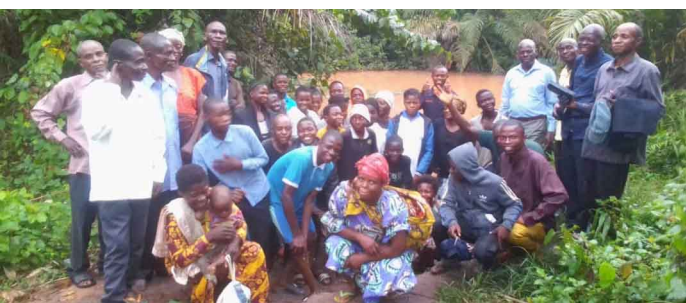
Evaluation annuelle des activités au sein des assemblées Dibumba et Kanzala