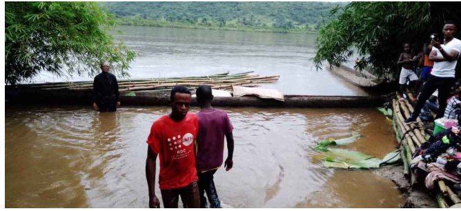
Baptême à Dibatayi