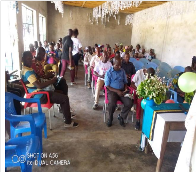
Séances d'encadrement des jeunes par les anciens

La rencontre de deux anciens et les responsables des jeunes a suscité un nouvel enthousiasme et des idées innovantes pour les jeunes. Cela a permis une session sur l'interaction créative avec la Bible et le ministère parmi les enfants et les jeunes par les jeux et le sport. Plusieurs des 89 représentants participants se sont engagés à planifier des camps ou à se joindre à d'autres lors de camps communs d'ici à 2023. Un des anciens a dit : « Cette session était exactement ce que nous avions besoin, cette rencontre a suscité un véritable réveil. Chacun a profité de l'occasion pour partager, apprendre ensemble et être outillé pour la suite. »