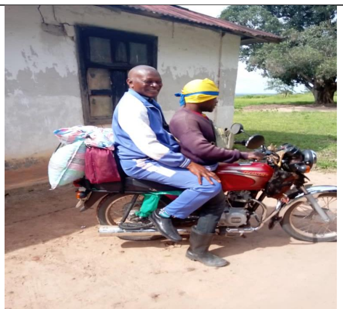
Frere Jamar a effectué voyage vers bena tshiadi à Moto