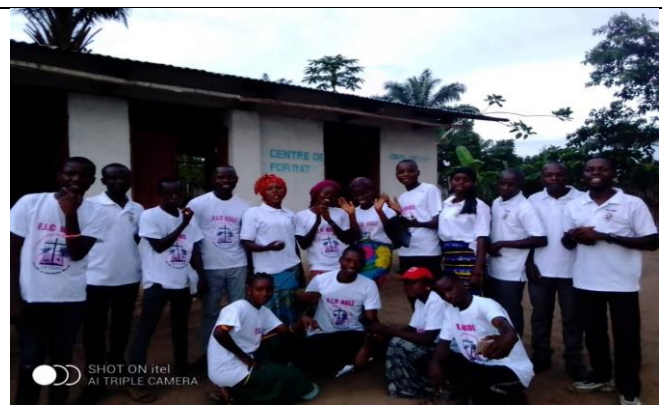
Les jeunes lors de la célébration de la journée de FJC