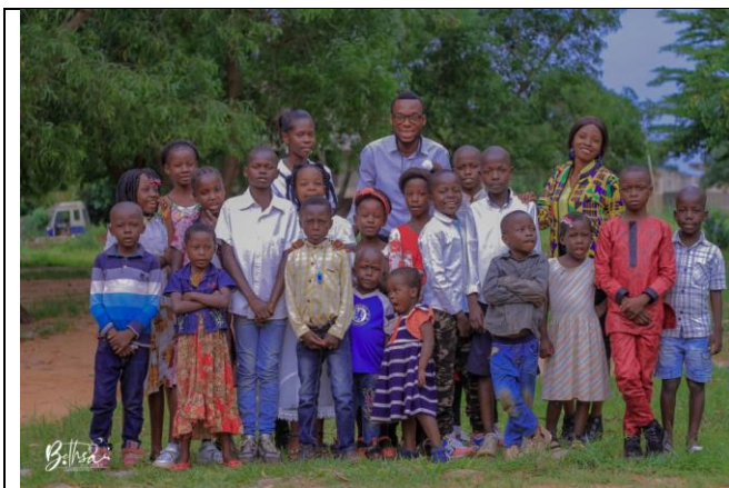
Les enfants de l'Ecodim assemblée Etoile