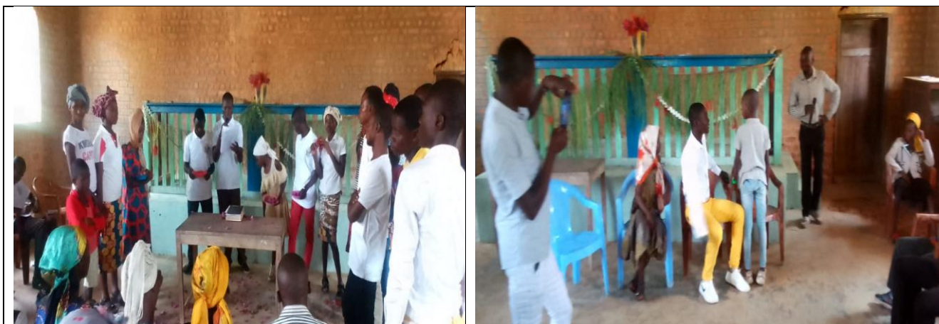
Rencontres des jeunes sur le fonctionnement de la FJC et partage des témoignage à Tshudi loto avec une séance des jeux bibliques de rôle