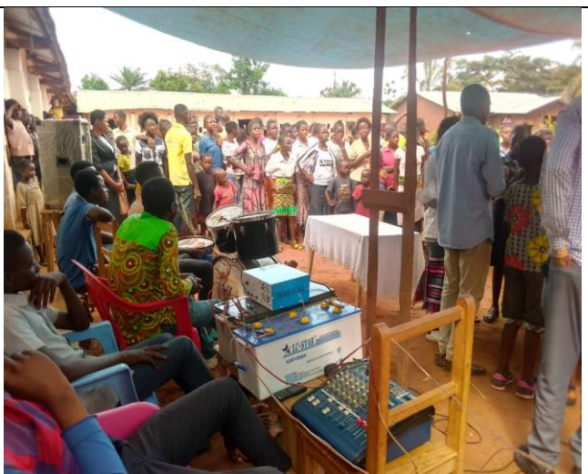
Réunion d'édifications des assemblées de Ngandajika