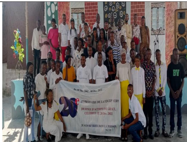
Journée de l'anniversaire (20eme ) de la FJC , jeunes de Kinshasa à l'assemblée de Mikondo.