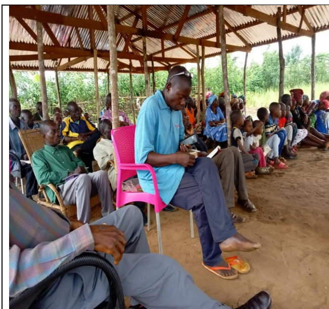
Réunion sur la prière à Mimbelenge 2 jours