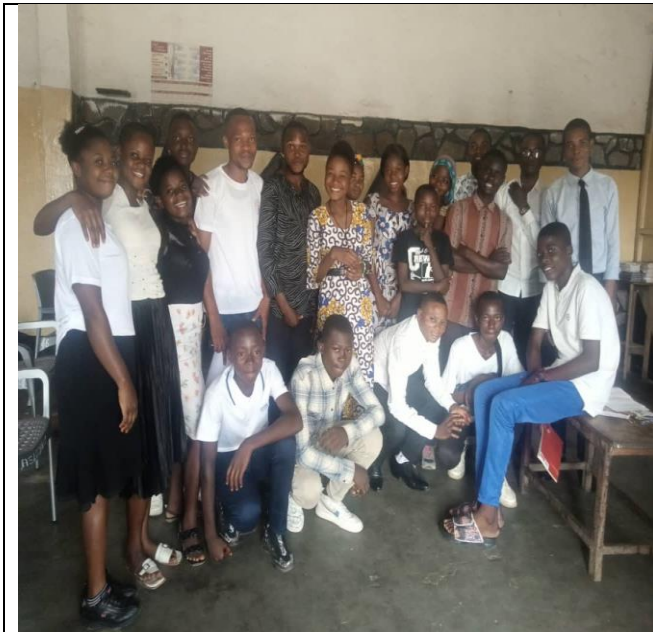
Réunion des jeunes à Kananga