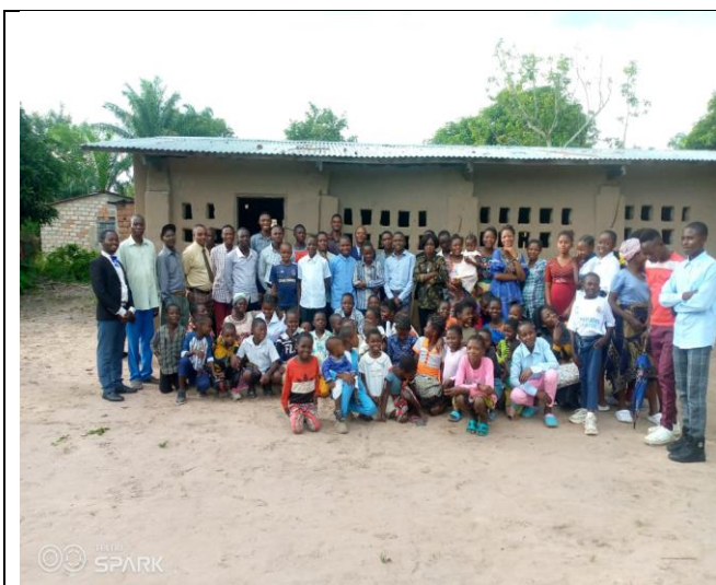
Réunion de la semaine à Muene Ditu