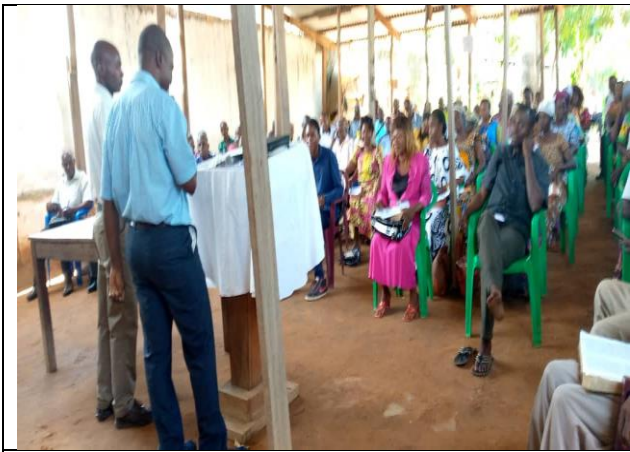
Enseignement sur un bon soldat de Christ.