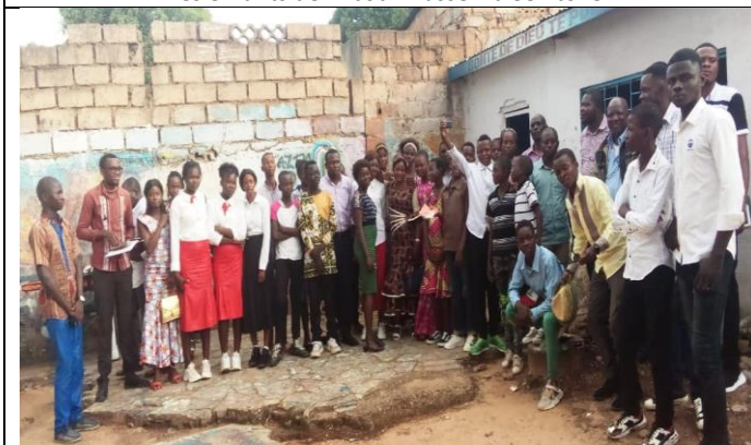
Culte d'actions de grâce avec les jeunes 20 ème anniversaire FJC