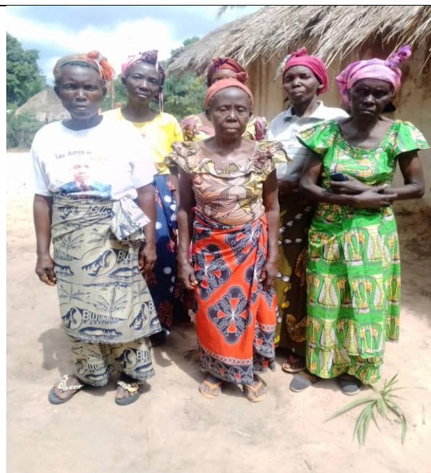
Les veuves de l'assemblée de Katete