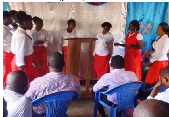
20 ème Anniversaire de la FJC à Etoile