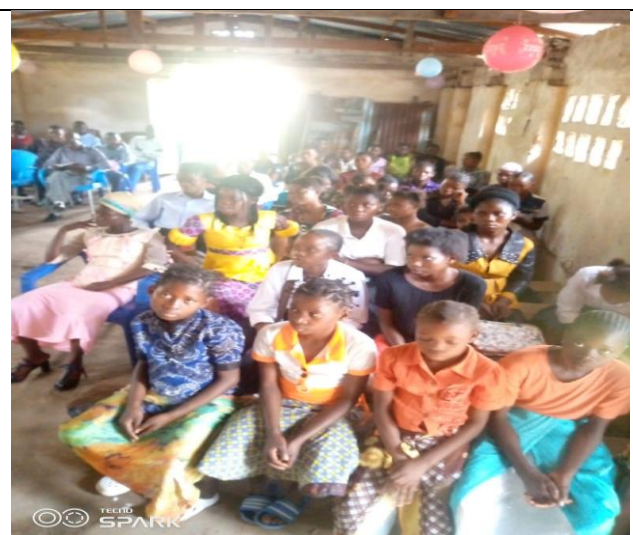
Séance d'édification des jeunes