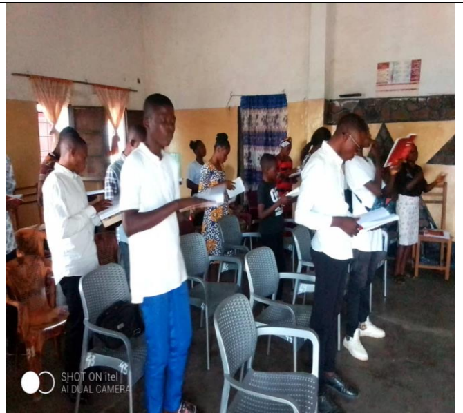
Célébration de l'anniversaire de FJC à Kananga