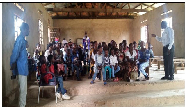
Réunion préparatoire des jeunes pour la journée du 20 /12/2022 avec le soutien de l'église locale de Kabinda