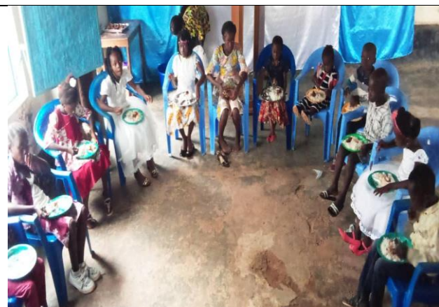
Partage de repas avec les enfants