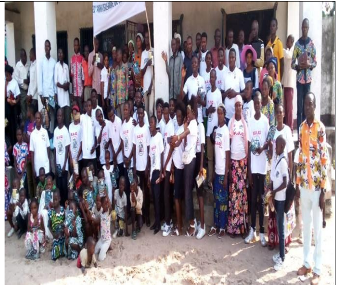
Photo de faille après culte du 20 Décembre 2022 à Lodja