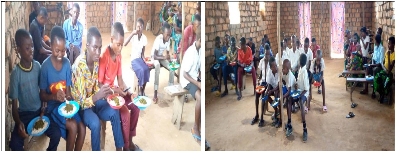
Réunions dans enfants de l'école de dimanche à Samba / Kongolo

Comme croyants, nous nous sentons proches aussi de ceux qui, ne se reconnaissent pas d'aucune tradition religieuse, mais qui cherchent sincèrement la vérité, la bonté, la beauté, qui pour nous ont leur expression plénière et leur source en Dieu et en sa parole. Un espace particulier est celui des dénommés nouveaux aréopages, les frères souhaitent être consolés régulièrement vu les distances les séparant de Lubao et de Mitombe.