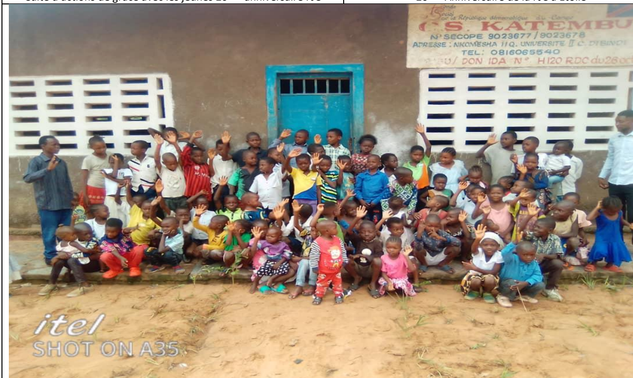
Les enfants de l'école de dimanche lors de la fête de la nativité, le 25 décembre dans l'assemblée locale de Nouvelle ville