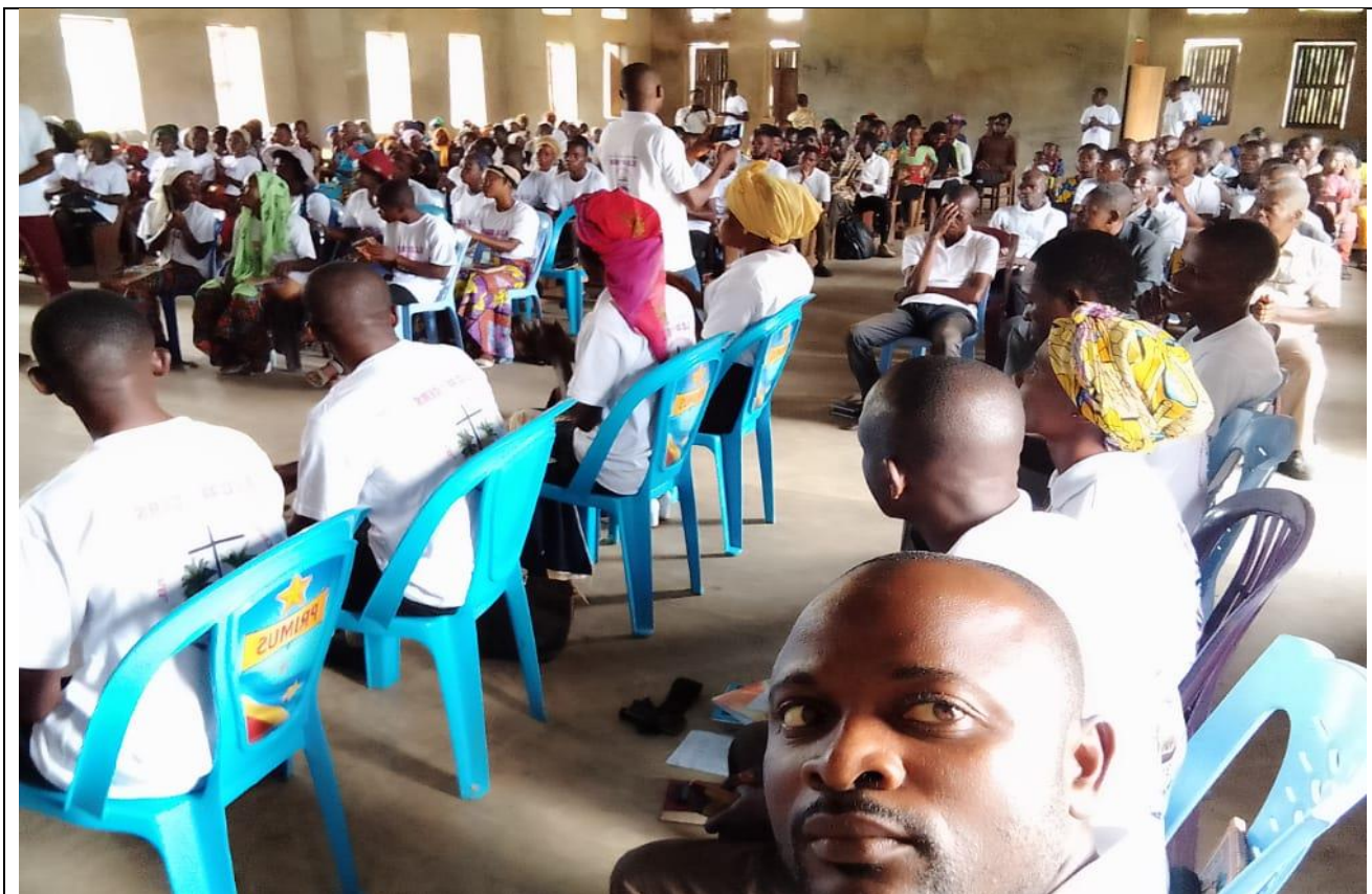
Au culte lors du 20 ème anniversaire de la FJC au local de Station Kole