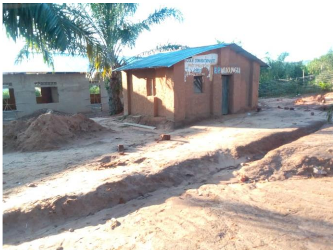
Ancien bureau de l'EP mukungu

Sous l'initiative des frères, une école primaire a été créée à MUKUNGU, dans la commune de Kabuela-Buela. Cette école a bénéficié d'un appui en construction, en partenariat avec le Gouvernement Central pour améliorer les conditions des élèves et des enseignants. Les travaux de construction se poursuivent pour un enseignement de qualité.