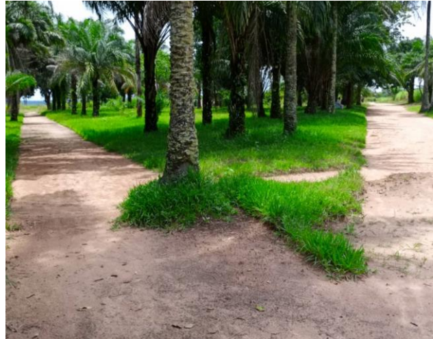
La concession de la station de Mitombe