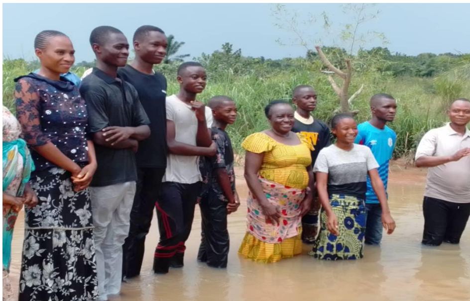
10 Personnes baptisées église locale de Kananga centre

Les jeunes des assemblées de Kananga Centre et de Kananga 2 se sont rencontrés pour échanger sur l'avancement des activités spirituelles dans la région. Il est à signaler aussi le service de baptême qui a eu lieu au cours du même mois (10 personnes ont été amenées aux eaux de baptême).