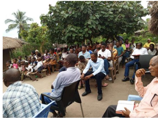
Mission d'évangélisation à Lumpembe

Deux séminaires bibliques sur l'épître aux Romains se sont tenus et les correspondants ont reçu avec joie et en guise de récompense leurs Bibles. Les correspondants ont été encouragés à poursuivre les autres séries des cours bibliques par correspondance, au lieu d'abandonner cette étude après avoir reçu la Bible.