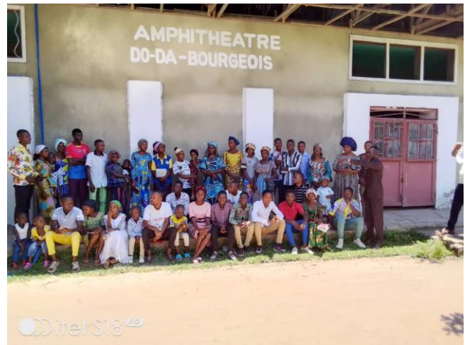
Aumônerie universitaire à l'ISTSAN Lodja