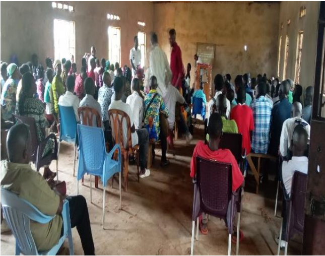
Lors du culte du 31 Mars 2024 assemblée locale de Kabinda

Nous avons constaté avec joie et gratitude, le dynamisme, la vitalité des jeunes et des familles lors des différentes réunions d'assemblée . Ces diverses rencontres ont permis une organisation d'un service d'accompagnement de trois personnes qui ont donné leurs vies au Seigneur. Au dernier dimanche du mois, il y a eu un enseignement sur « ...Allons-y maintenant, peut-être nous enseignera-t-il le chemin par lequel nous devons aller » (1 Samuel 9 : 6), avec une participation de 155 frères, sœurs et enfants.