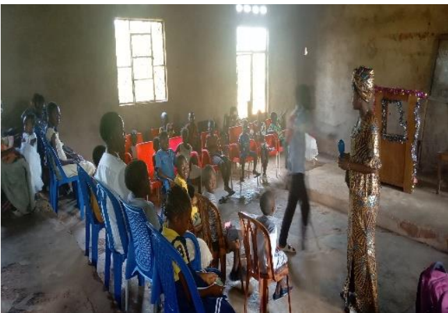
Dimanche du 10 Mars 2024

Le service à l'école de dimanche se poursuit avec beaucoup de joie, les enseignements pour découvrir les vérités bibliques sous l'encadrement des moniteurs sur plusieurs thèmes avancent bien. Au cours du mois, il y a eu les enseignements sur « la naissance de Jésus et les cadeaux des mages ». Les anciens ont assuré l'accompagnement des familles en deuil et en situation difficiles, (cas de ceux qui ont été hospitalisés, par exemple la Sœur Bapile à l'hôpital général de référence de Kabinda).