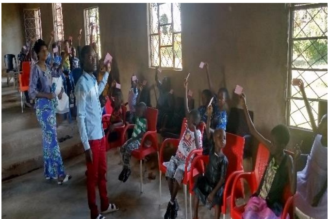
Dimanche du 17 Mars 2024