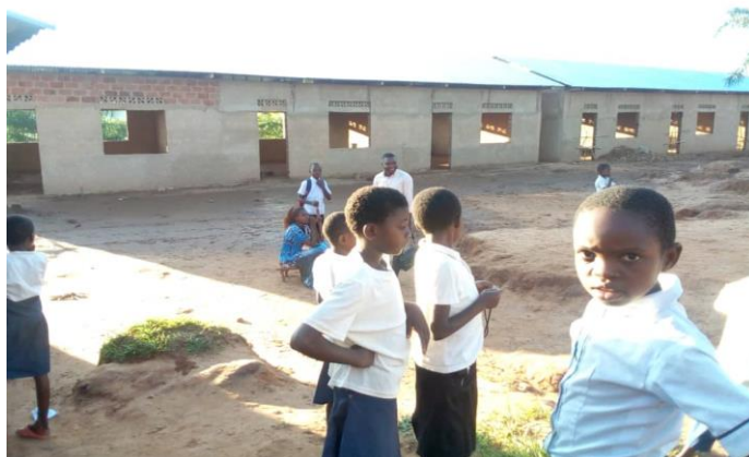
Nouveau bâtiment en pleine construction

Tout en poursuivant la fourniture d'ouvrages et la traduction des traités en langue locale comme : « Ka mpika kabakashi ka Beena Isalele » en français « La Petite Esclave Israélienne », nous vous invitons de consulter notre site web sur le tableau des traités en langue Kisongye numéro 18 pour télécharger votre copie : Site de la CERS Kisongye (www.33eme-cers.org) . La littérature chrétienne à Kabinda développe ses activités sur le terrain dans l'accompagnement des équipes locales dans la distribution et correction des cours bibliques en langue et d'un renforcement des capacités des frères dans les assemblées de la ville de Kabinda.