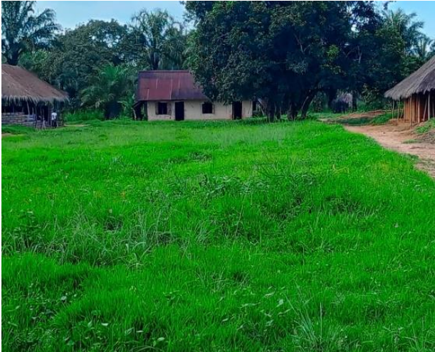
état actuel de l'Institut Muidingie de Mitombe

Le comité du travail de la station a organisé des temps de réflexion sur l'état actuel des bâtiments de l'Institut MUIDINGIE. Ces réflexions ont contribué à préparer la rencontre des responsables, des anciens élèves de cette école sur le thème : « Vers une nouvelle image de l'Institut Muidingie ». Un groupe WhatsApp dénommé « Anciens de Muidingie » a été créé pour sensibiliser ses membres à une cotisation pour soutenir les efforts de la reconstruction de cette école.