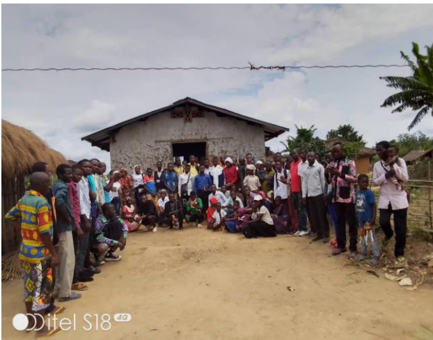
Après culte à l'assemblée de EHEKO

Le camp biblique a eu lieu à EHEKO, plus de 180 participants ont eu un enseignement riche sur « Attention : les faux prophètes ». Des jeunes des assemblées voisines ont été invités à y participer. « Je crois que j'ai vécu dans ce camps-là, une plus belle expérience chrétienne de ma vie. Je reste étonné de cet appétit des autres jeunes pour la Parole. Je suis fasciné aussi par l'intelligence intérieure qu'ont ces jeunes, sur la Parole qui nous transforme ». (Témoignage d'un participant). Toujours sous l'impulsion des jeunes, une initiative des travaux d'assainissement pour rendre l'environnement sain a été adoptée pour chaque samedi. Quelle satisfaction nous apporte la parole de Dieu et la participation à l'aumônerie à l'ISTSAN ! Quelle source d'inspiration.