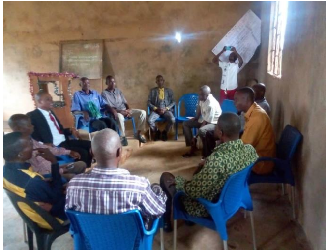
Réunion de planification des activités de la semaine par les anciens

Le service à l'école de dimanche se poursuit avec beaucoup de joie, les enseignements pour découvrir les vérités bibliques sous l'encadrement des moniteurs sur plusieurs thèmes avancent bien. Au cours du mois, il y a eu les enseignements sur « la naissance de Jésus et les cadeaux des mages ». Les anciens ont assuré l'accompagnement des familles en deuil et en situation difficiles, (cas de ceux qui ont été hospitalisés, par exemple la Sœur Bapile à l'hôpital général de référence de Kabinda).