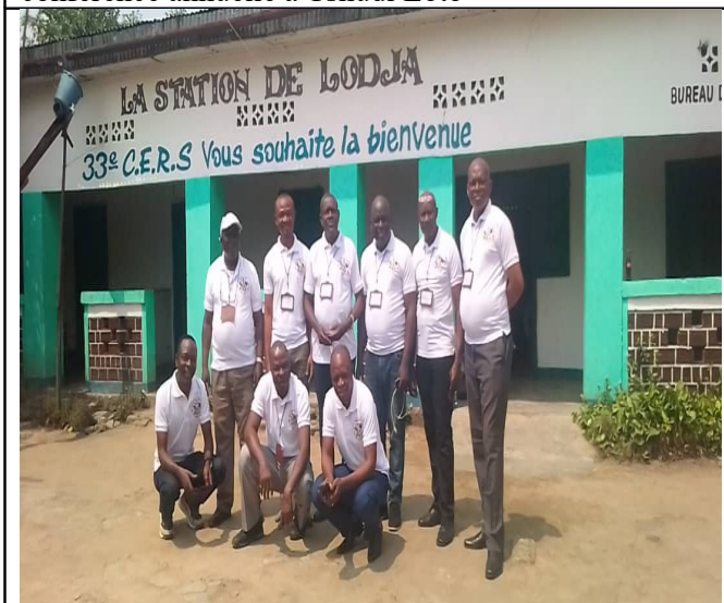
Les frères Membres Effectifs présents aux réunions de la Communauté à Lodja

Des rencontres importantes des frères Membres Effectifs de la 33eme CERS ont été tenues en fin juillet et début août 2022 à Lodja pour le Conseil d'Administration et l'Assemblée Générale Extraordinaire. Elles se sont bien déroulées pour le bon fonctionnement aujourd'hui ; l'avenir de la Communauté et la bonne marche des Assemblées. Il ressort de ces réunions une vision de l'avancement, de l'agrandissement du travail avec la création de 4 nouveaux Centres évangéliques qui devront s'organiser de manière autonome en les détachant de leurs anciennes stations vu l'ampleur du travail par le nombre d'assemblées autour d'eux et les distances qui les séparent de leurs anciennes stations. Il s'agit de Lomela Centre, Inera Mukumari, détachés de Tshudi Loto, Bena Dibebe détaché de Kole et Lubao détaché de Mitombe.)