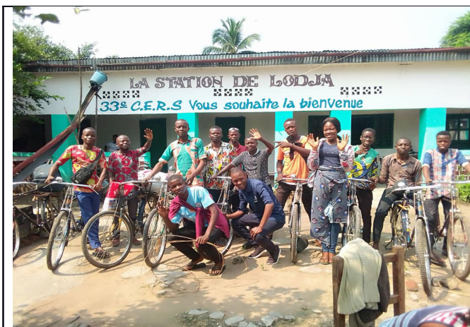
Les jeunes de l'assemblée de Lodja départ pour la conférence annuelle à Tshudi Loto