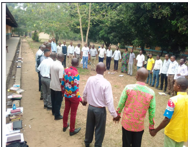
Lors de la retraite organisée à Mbuji mayi