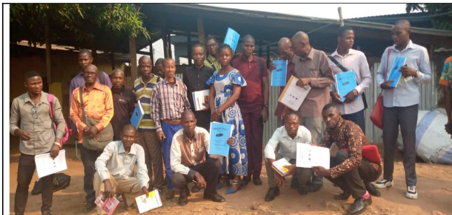
Fin de la formation sur les EBS à Tshikapa

enfants à obéir Dieu avec l’outil cours biblique, en prenant l’exemple de Jésus qui “croissait en sagesse, en stature et en grâce devant Dieu et devant les hommes.” (Luc 2 : 52. Ils ont partagé leurs expériences et leurs sentiments, en découvrant la vérité, et en choisissant quelque chose qu’ils pourraient faire chaque semaine en réponse aux informations apprises lors de la formation.