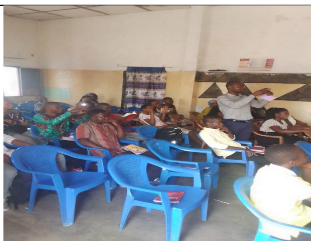
formation de vivre libre en christ