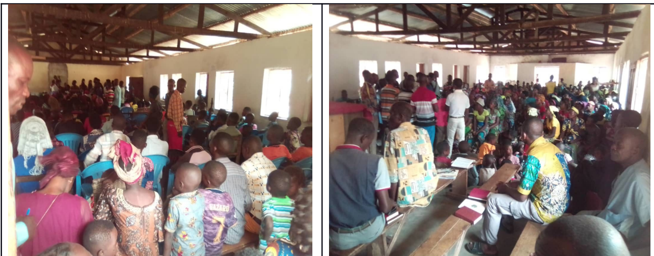
Camp biblique des jeunes organisé dans l'assemblée locale de Mitombe