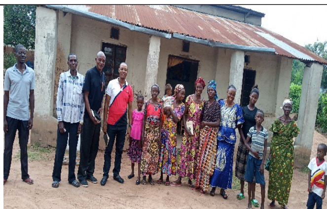
Quelques frères et sœurs à la sortie de la réunion de prière à Lubao