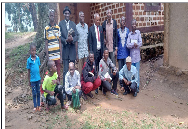
Lors de la restitution de la formation de la retraite de Mbuji mayi avec les assemblées de Kabinda

La mission médicale chrétienne vise à assurer la santé à tous les êtres humains, en ce sens que tout le monde, dans les assemblées, aurait accès à des soins de santé de qualité. Les Églises participent et peuvent participer de multiples façons à la santé et à la guérison dans un sens global. Elles créent ou assistent les frères et sœurs dans des cliniques et des hôpitaux. Au cours de ce troisième trimestre 2022, les frères dans les églises locales ont proposé des services sociaux, des groupes d'accompagnement des malades et des programmes de santé en créant des groupes chargés de visiter les malades.