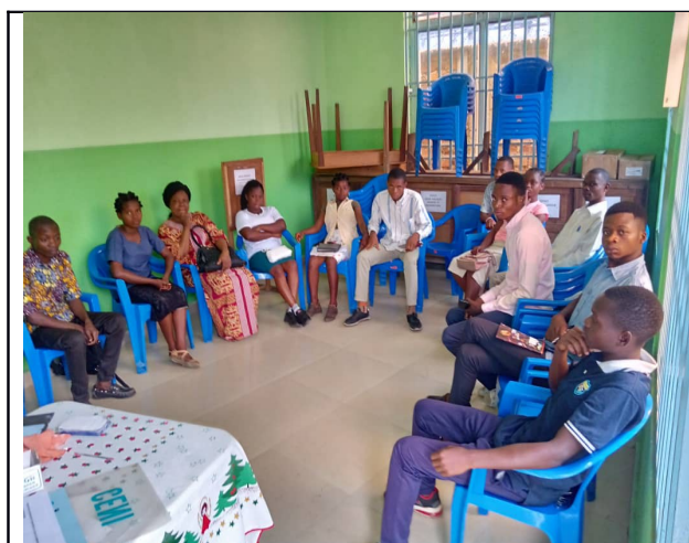
Formation de moniteurs